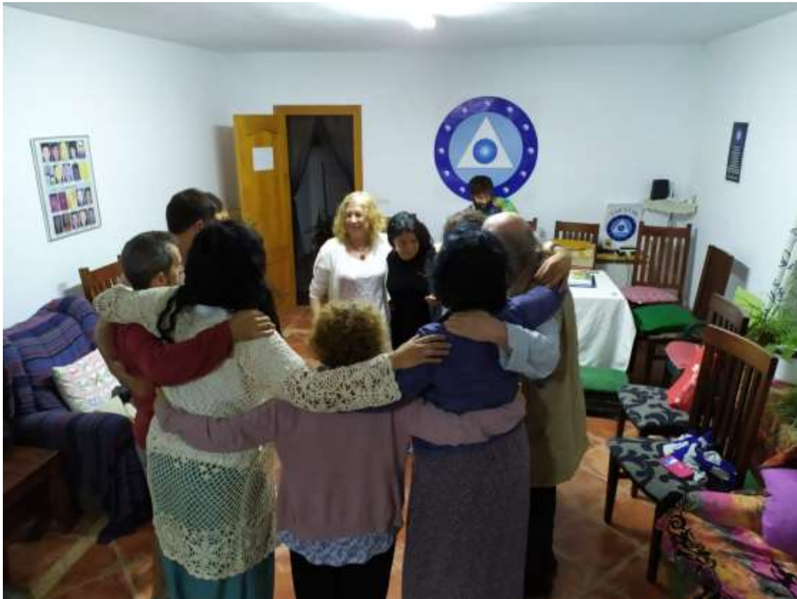
Después de la energetización de Aium Om