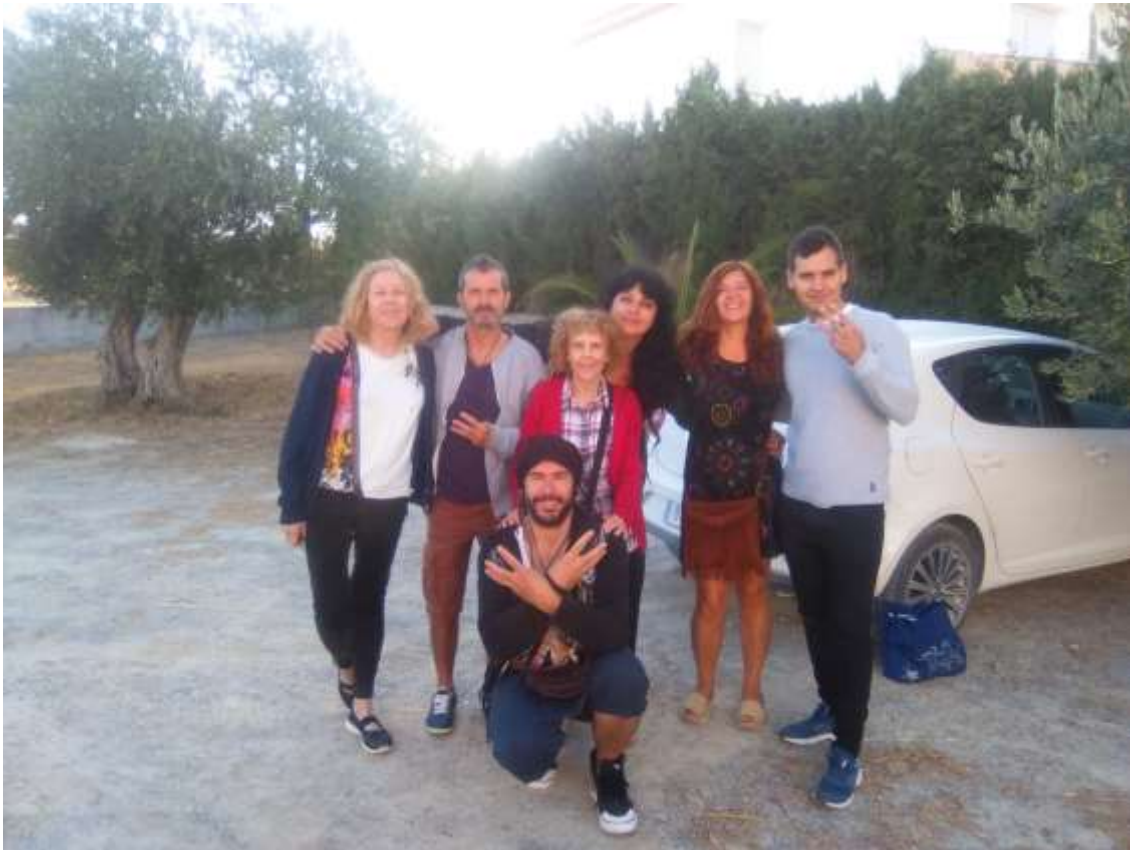
De izquierda a derecha: Liceo, Oro en Polvo La Pm, Fácil es Hallarlo La Pm, Seguro Que Es Así La Pm, Capitel Pi Pm, Una Pica en Barcelona La Pm y (sentado) Lo Tienes Todo La Pm