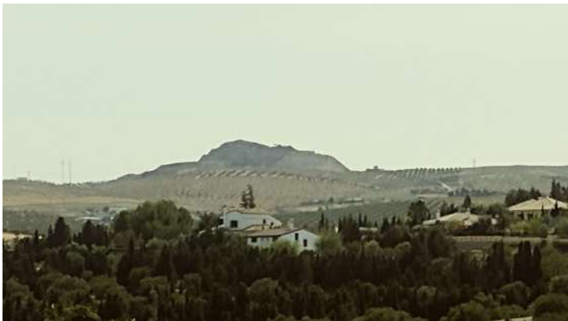
Montevives desde el Muulasterio Tseyor La Libélula