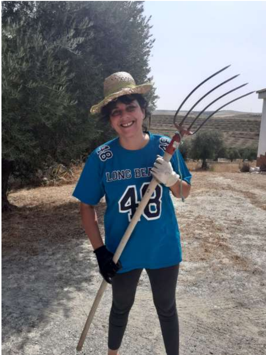
La hermana Seguro Que Es Así La Pm nos ayudó en las tareas de jardinería y mantenimiento del patio exterior

Las tardes las dedicamos a realizar mesas redondas en donde se trataron temas tales como: Cerrando círculos, la divulgación en Granada historia y nueva proyección. Situación del edificio del Muulasterio de La Libélula.