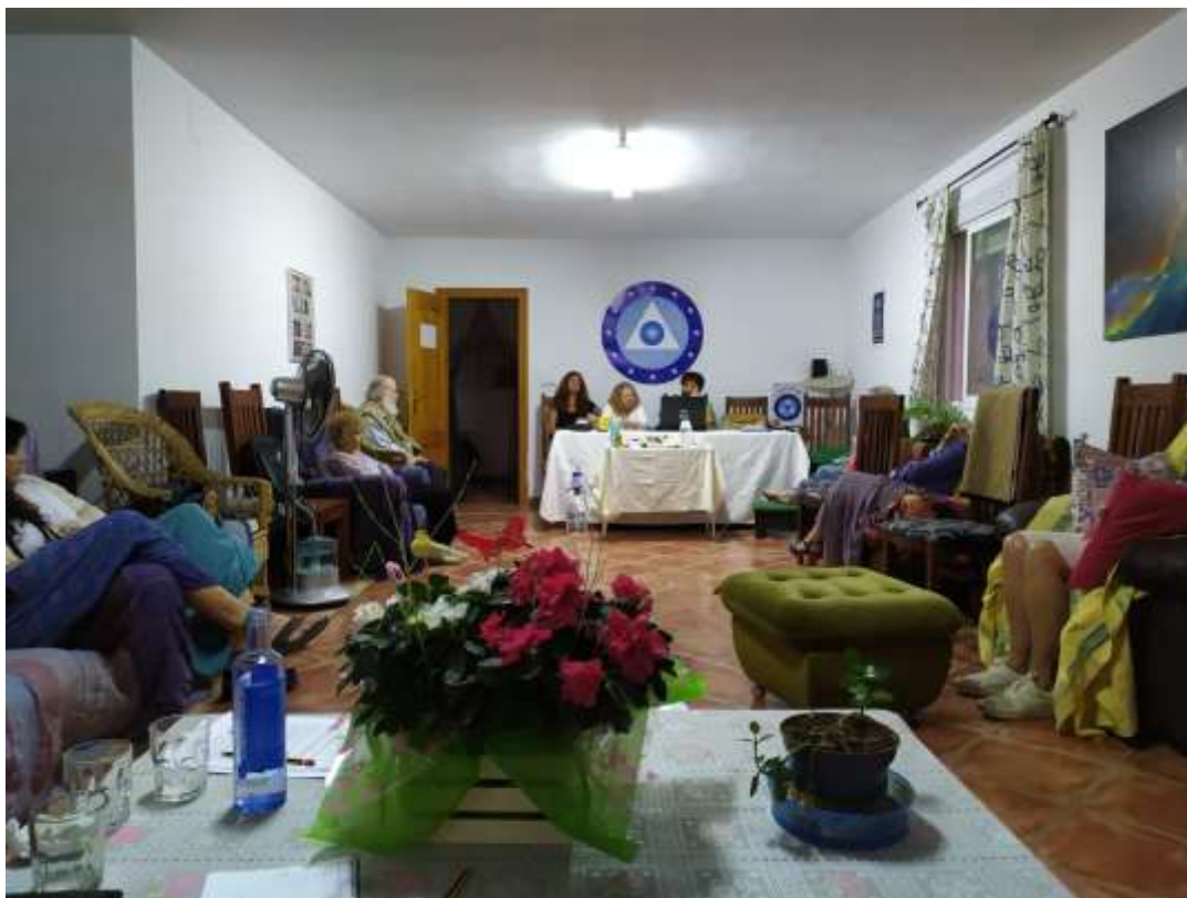
Momentos previos a la energetización