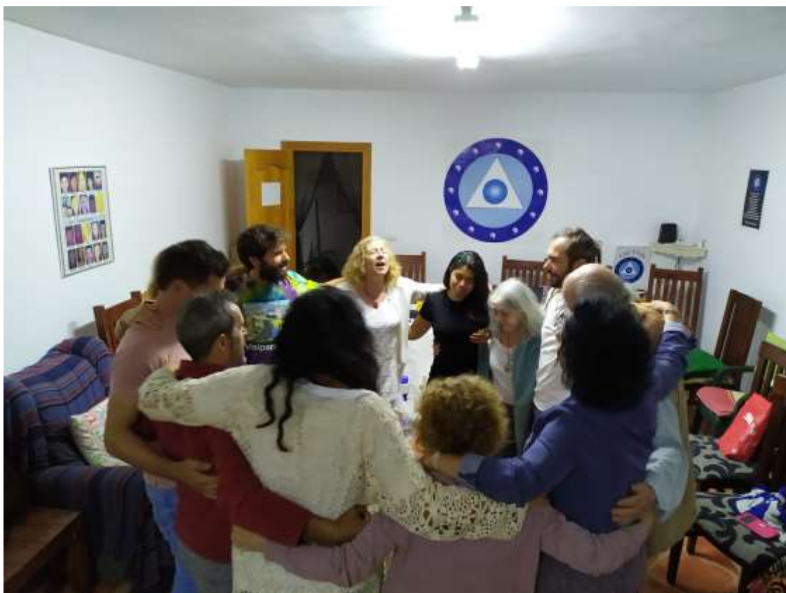
El círculo se ha cerrado con éxito

Nos hemos quedado con la satisfacción de haber hecho un trabajo muy profundo y regenerador. Habiendo cerrado muchos círculos del pasado que impedían a modo de atasco el libre funcionamiento del grupo, que por no haberlo trabajado en su momento perduraba hasta estos días.