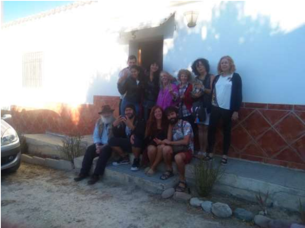
Final de convivencia, en la entrada principal del Muulasterio