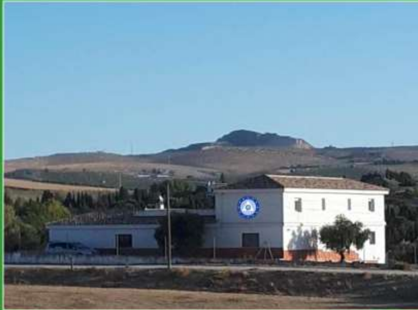
MUULASTERIO TSEYOR LA LIBÉLULA CON MONTEVIVES AL FONDO GRANADA-ESPAÑA

TSEYOR CENTRO DE ESTUDIOS SOCIOCULTURALES UNIVERSIDAD TSEYOR DE GRANADA (UTG) ONG MUNDO ARMÓNICO TSEYOR