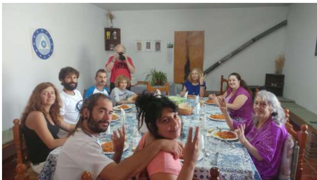
Durante una de las comidas

Todos los días las sesiones se realizaron de manera presencial para los que asistieron y virtual para aquellos hermanos que no pudieron acudir.