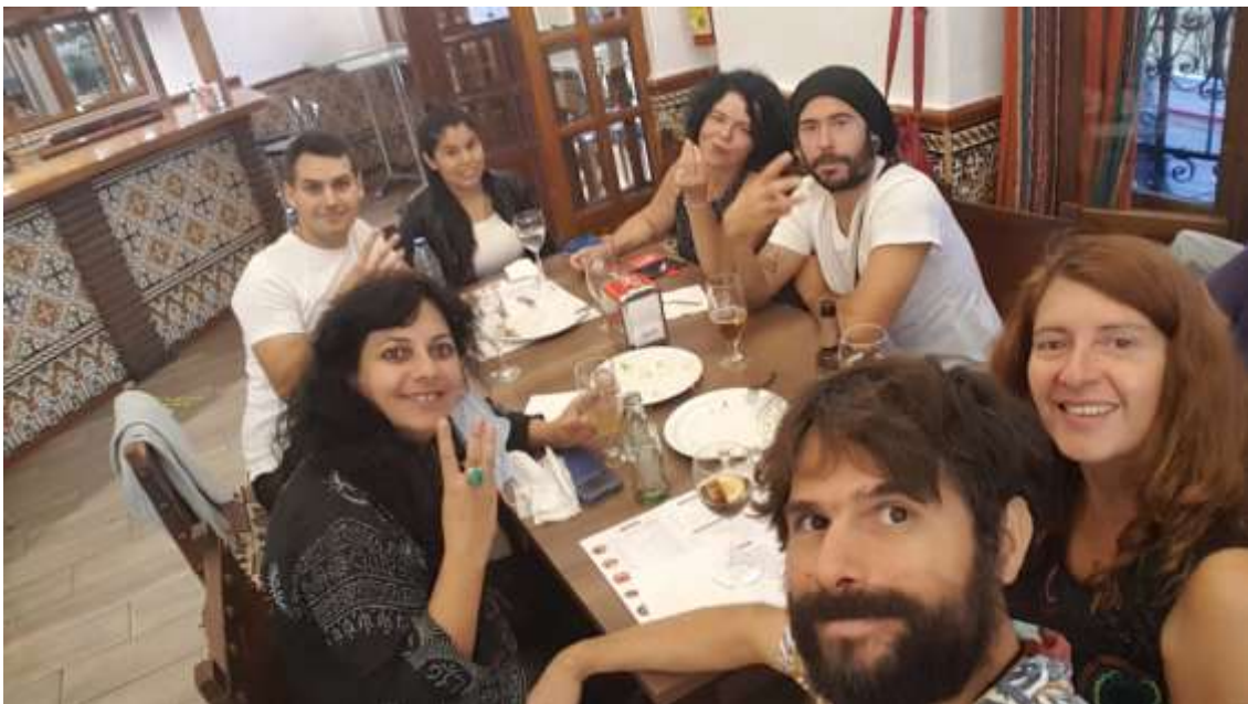
Paseo por Granada después del retiro