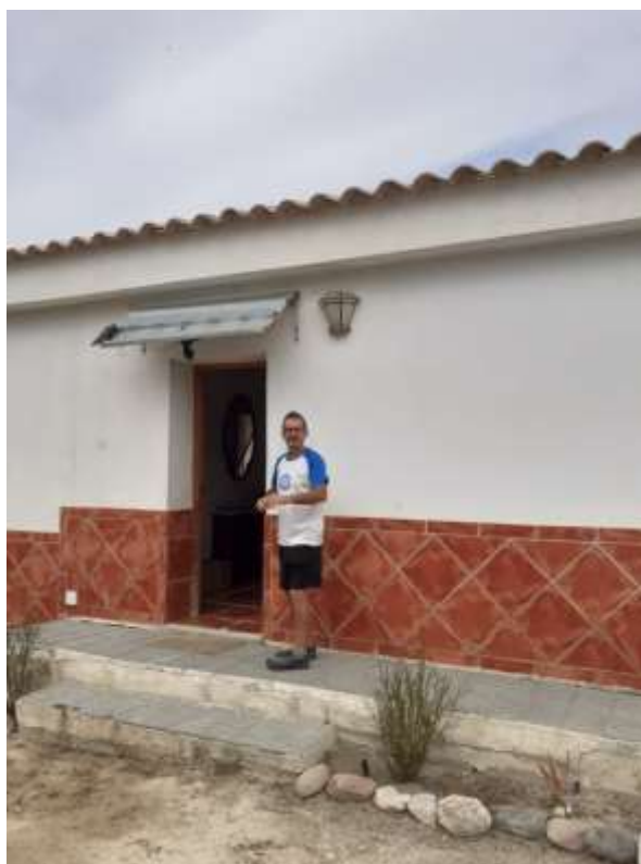
Oro en Polvo La Pm en la puerta del Muulasterio