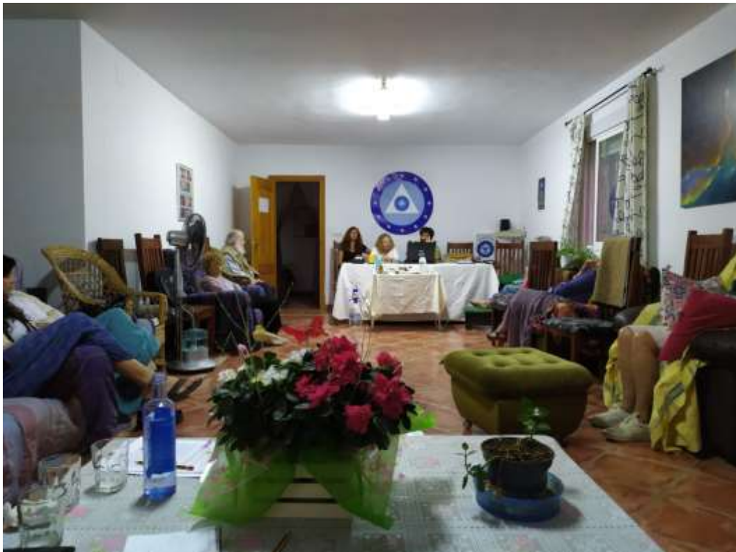
Salón donde se celebró la energetización