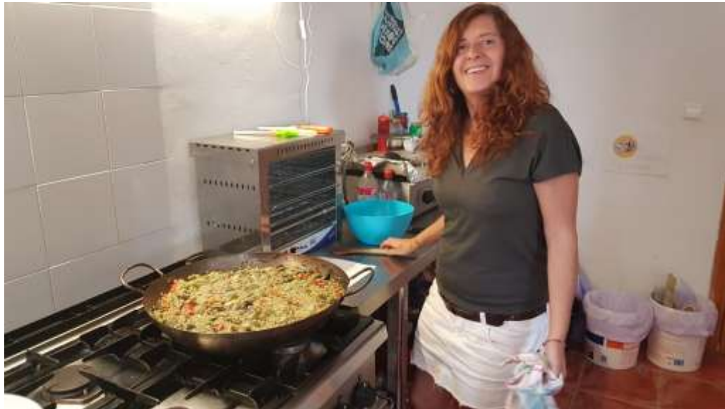
Capitel Pi Pm cocinando

Por otro lado, las dificultades económicas que asomaban para el sostenimiento de las instalaciones también se desvanecieron, gracias a Shilcars, quien nos brindó una sencilla solución de sostenimiento, en base a hermanos y/o hermanas Muul residentes que además hagan un trabajo de divulgación en la zona.