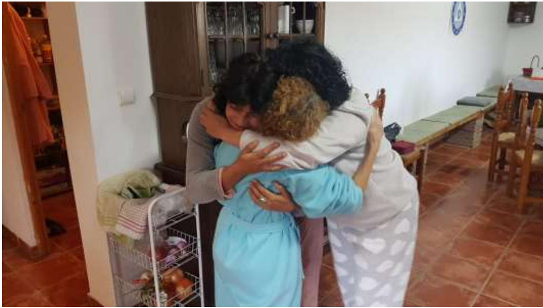
Los abrazos son habituales en estos momentos