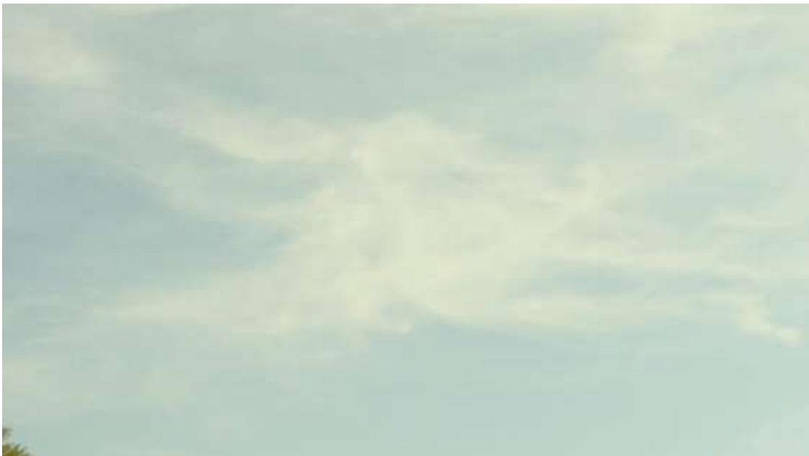
Foto de nubes sobre el Muulasterio durante la convivencia