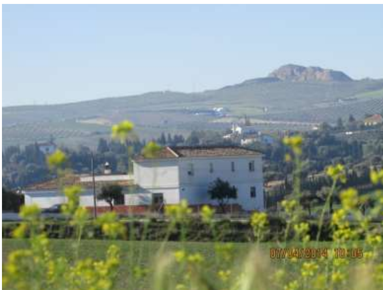
Muulasterio Tseyor La Libélula con Montevives al fondo (Granada)