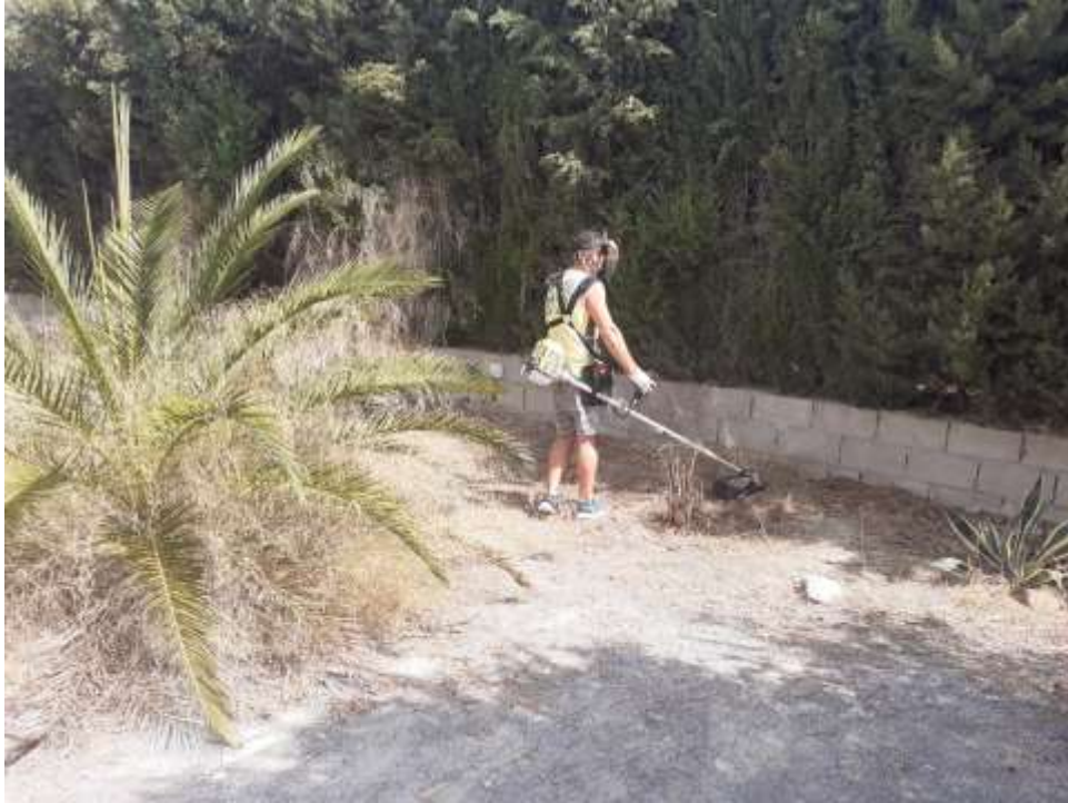
El hermano Lo Tienes Todo La Pm nos ayudó a cortar el césped, las hierbas estaban muy altas

Noiwanak, por su parte, nos habló de la puesta a punto del proyecto. Necesitamos todavía más vibración para lograr ciertos objetivos trascendentales, que tienen que ver ya con un encuentro vis a vis con los hermanos de la Confederación de Mundos Habitados de la Galaxia. Es decir, hablamos ya de un encuentro en tercera fase. Y para ello, es necesaria la debida preparación, psicológica y mental, y el debido grado vibratorio.